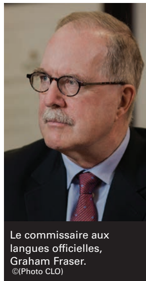
Le commissaire aux langues officielles, Graham Fraser.