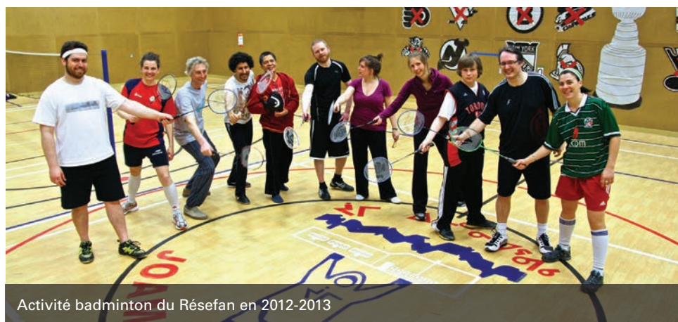
Activité badminton du Résefan en 2012-2013

Finalement, le RÉSEFAN en a profité pour saluer et remercier la communauté francophone de l'appui qu'elle voue à son organisme, encourageant ses membres à poursuivre l'important travail de collaboration. Dans son dernier courriel aux membres, le directeur général sortant indique en effet : « Il y a encore beaucoup à faire pour la consolidation et le développement de services de santé et de mieux-être en français au Nunavut. »