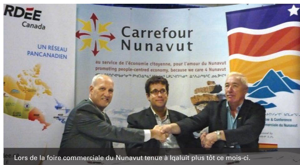
Lors de la foire commerciale du Nunavut tenue à Iqaluit plus tôt ce mois-ci.

Un groupe national de travail composé d'agents de développement économique des communautés francophones et acadienne s'est réuni à Iqaluit entre le 6 et le 10 octobre dernier, pour travailler sur les moyens de stimuler les échanges entre la francophonie et le milieu économique canadien. Carrefour Nunavut a accueilli la délégation dont les participants, incluant le Carrefour, sont tous membres du Réseau de développement économique et d'employabilité (RDÉE) Canada.