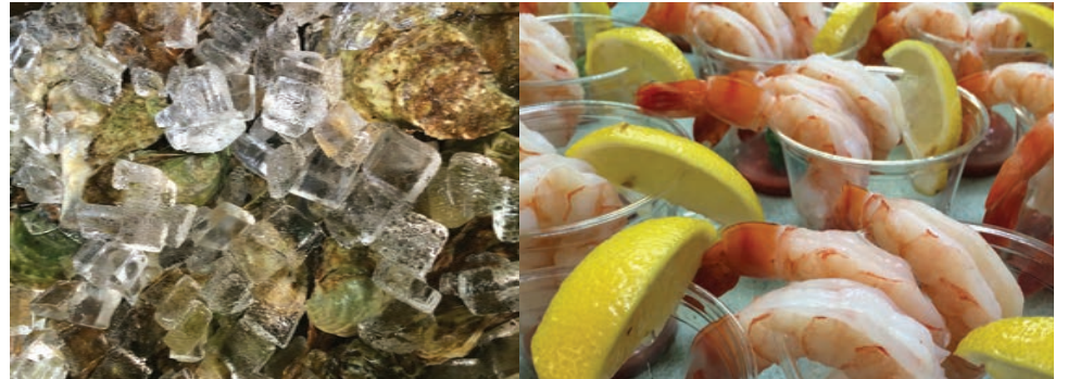
Huîtres fraîches et crevettes accompagnées d'une sauce maison, servies lors de l'événement.

Avec les commentaires reçus au sujet de la soirée et surtout grâce à la popularité de la chaudière de palourdes d'Alex, parions que cet événement se retrouvera au calendrier l'année prochaine.